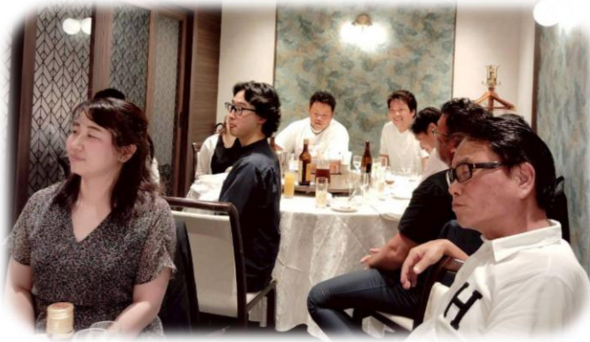
英国と日本の最高学府に入学されるお 二人。クラブとしても誇らしい限りです。