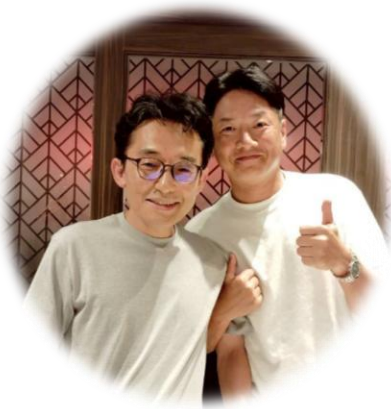
会員増強にも大活躍のSAAの新保会員。 先日、正式に次年度幹事を受諾されました！