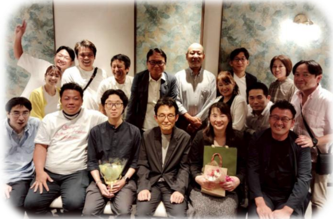
笑顔のあふれるいい夜でした。 若者たちと柏南RCの未来に幸あれ！